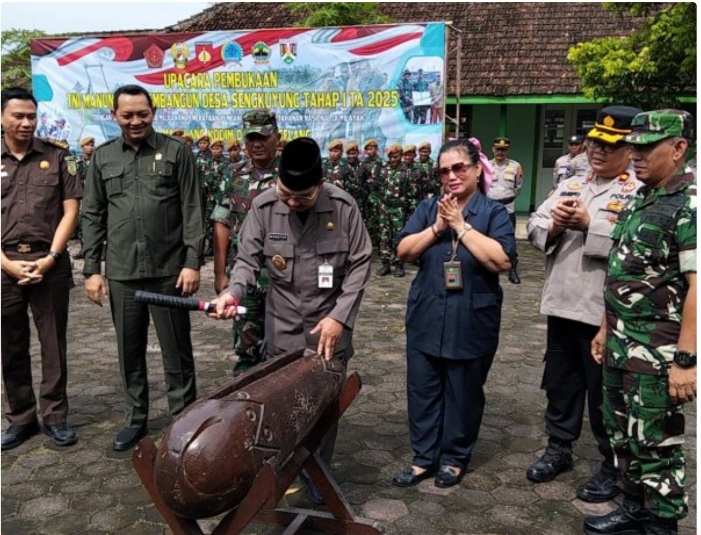
(Foto Dokumen) : Wakil Walikota Magelang didampingi Forkopimda memukul kentongan saat Upacara Pembukaan TMMD

MAGELANG - TMMD Sengkuyung Tahap I Kota Magelang secara resmi telah dibuka. Hal ini ditandai dengan digelarnya Upacara Pembukaan TMMD Sengkuyung Tahap I Tahun 2025 di Halaman SD Kartika III-3, Jl. Kapten Suparman, Kelurahan Potrobangsari, Kecamatan Magelang Utara, Kota